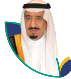
خادم الحرمين الشريفين الملك سلمان بن عبدالعزيز ال سعود