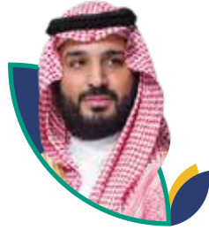
صاحب السمو الملكي الأمير محمد بن سلمان ال سعود