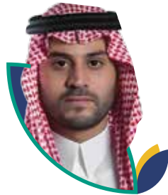
صاحب السمو الملكي الأمير فهد بن مقرن ال سعود نائب أمير منطقة حائل