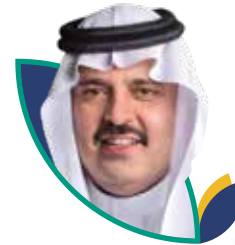
صاحب السمو الملكي الأمير عبدالعزيز بن سعد ال سعود أمير منطقة حائل