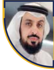
غازي طارق الشمري نائب الرئيس