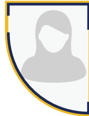
افراح الجروان مدربة حاسب آلي