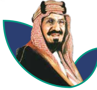
مؤسس المملكة العربية السعودية الملك عبدالعزيز بن عبدالرحمن آل سعود