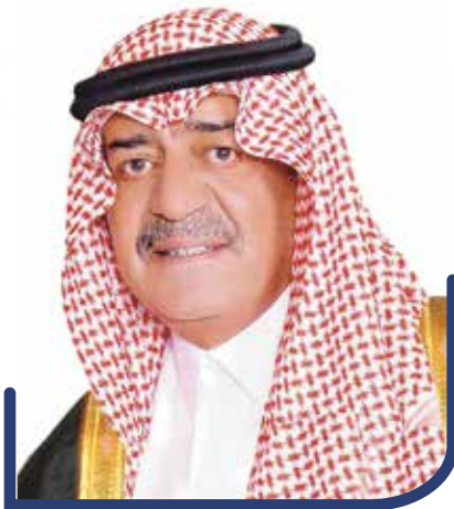
صاحب السمو الملكي الأمير مقرن بن عبدالعزيز آل سعود